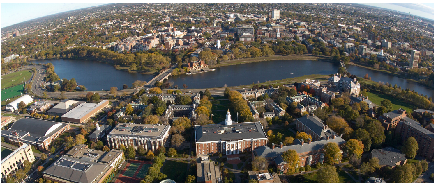
Foto: Vista aérea de Harvard Business School Campus, adyacente al futuro campus tecnológico de Harvard Allston.